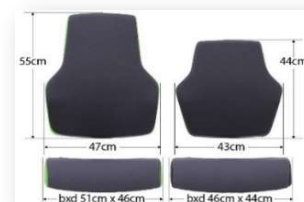
"At Work L"